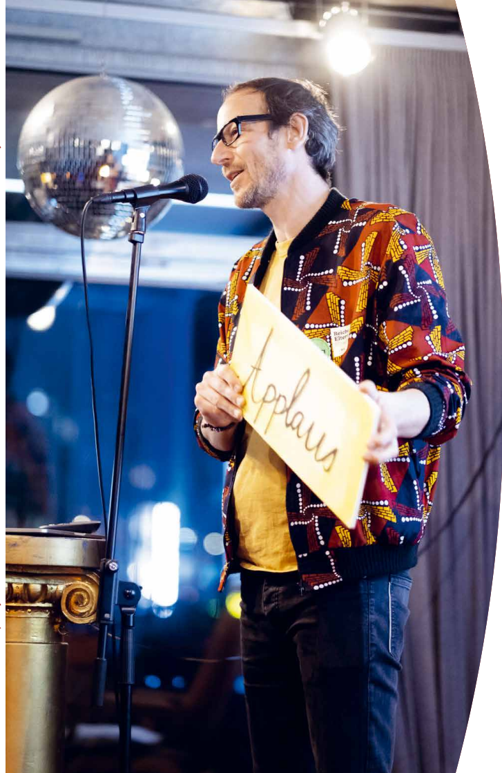
rechts: Präsentation beim Projekt »TING«