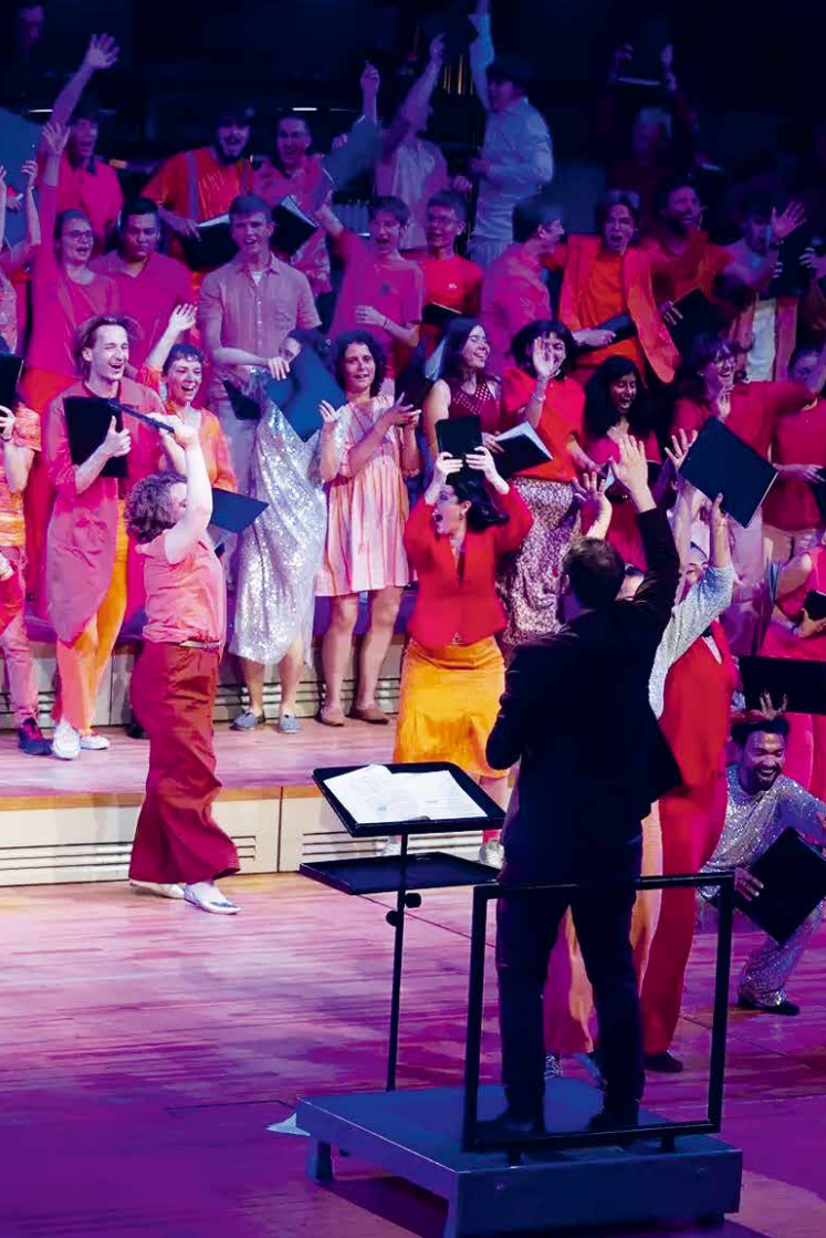
links: Chorprojekt »flammende erde«